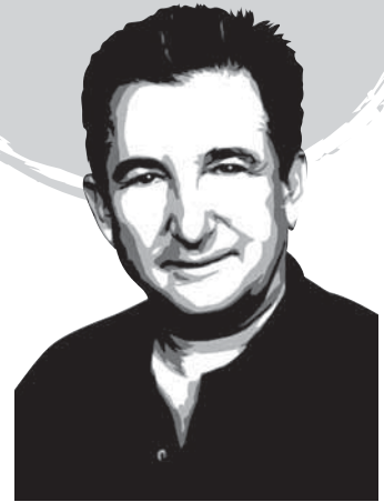
マーク・ダグラス (Mark Douglas)

本国アメリカよりも熱烈に迎え入れられた『ゾーン』は刊行から10年たった今も日本の個人トレーダーたちの必読書であり続けている！