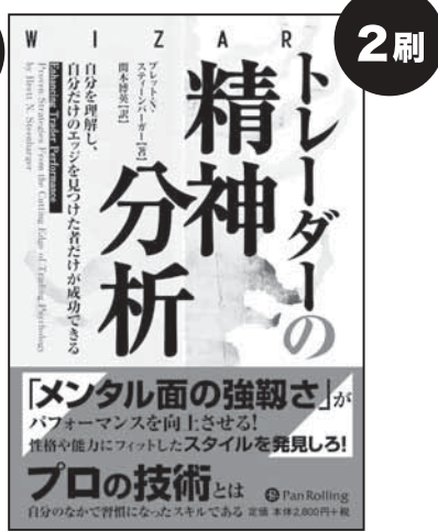
2刷 トレーダーの精神分析 定価 本体2,800円+税 ISBN:9784775970911

トレーダーや投資家たちが市場に飛び込んですぐに直面する問題とは、マーケットが下がったり横ばいしたりすることでも、聖杯が見つけれられないことでも、理系的な知識の欠如によるシステム開発ができないことでもなく、自分との戦いに勝つことであり、どんなときにも揺るがない規律を持つことであり、何よりも本当の自分自身を知るということである。つまり、トレーディングや投資における最大の敵とは、トレーダー自身の精神的・心理的葛藤のなかで間違った方向に進むことである。これらの克服法が満載されたウィザードブック厳選5冊を読めば、次のステージに進む近道が必ず見つかるだろう!!