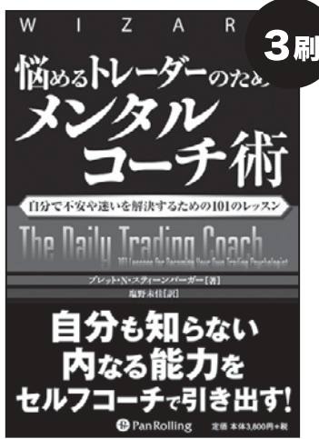
3刷 悩めるトレーダーのためのメンタルコーチ術 定価 本体3,800円+税 ISBN:9784939103575

なぜ儲からないのか。 自分の潜在能力を開花させれば、トレード技術が大きく前進することをセルフコーチ術を通してその秘訣を伝授!